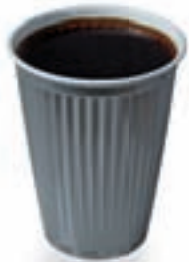
Becher 7 Cent

Den Preis können Sie regeln, für die Qualität sorgen wir!