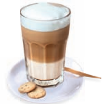
Glas 1,60 Euro